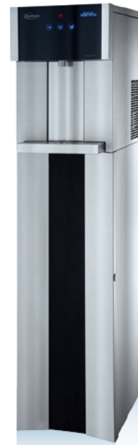
SodaMaster AquaTower 600